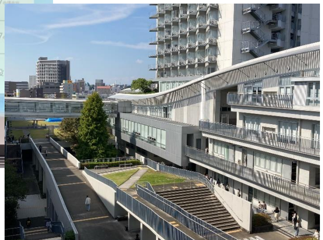
とてもきれいな学校です